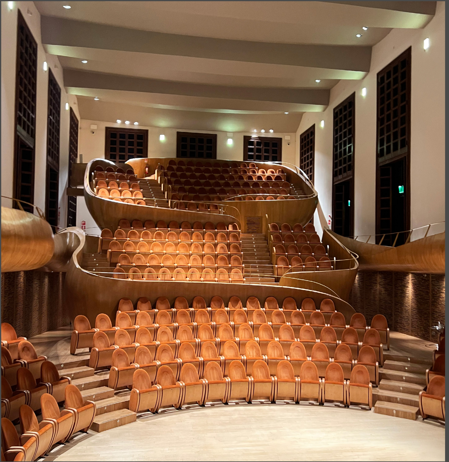
Museo del Violino Cremona, Piazza Marconi