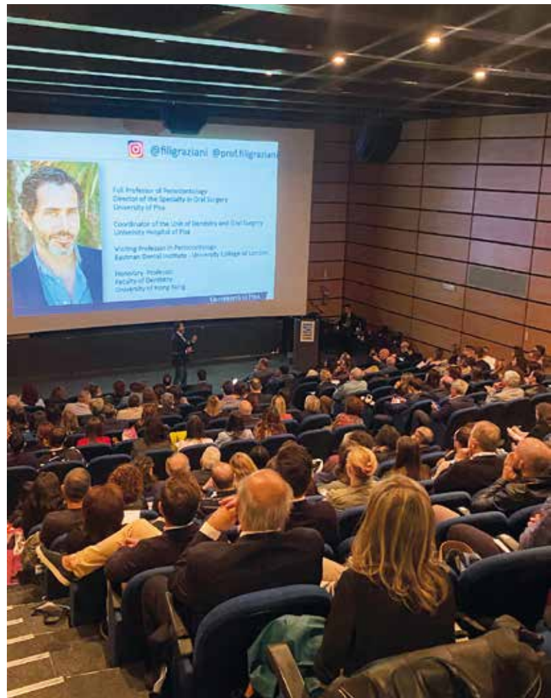
La platea dell'Auditorium all'Acquario di Genova

40 anni fa è iniziata la mission di A.B.E.O. LIGURIA Associazione Ligure del Bambino Empatico Oncologico