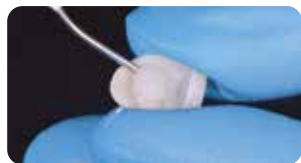
Applicazione Try in gel nelle faccette in ceramica per prova colore