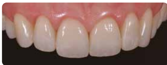
Le faccette in ceramica dopo la cementazione