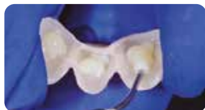
Applicazione EnaSoft flow per la cementazione dei provvisori