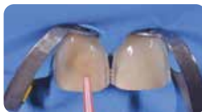
Cementazione faccette: fase adesiva