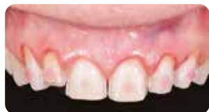
Mordenzatura a spot e applicazione Ena Seal per cementazione provvisorio

Ena Cem HV è un composito flow, fotopolimerizzabile, ad alta viscosità, messo a punto dal Dr. Lorenzo Vanini, che valorizza l'estetica delle faccette sia in ceramica che composito. L'alta viscosità e la alta tissotropia garantiscono una perfetta manipolazione per una facile applicazione e rimozione degli eccessi.