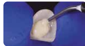
Applicazione di EnaCem HV, dopo sabbatura, mordenzatura, silanizzazione e applicazione di Ena Seal