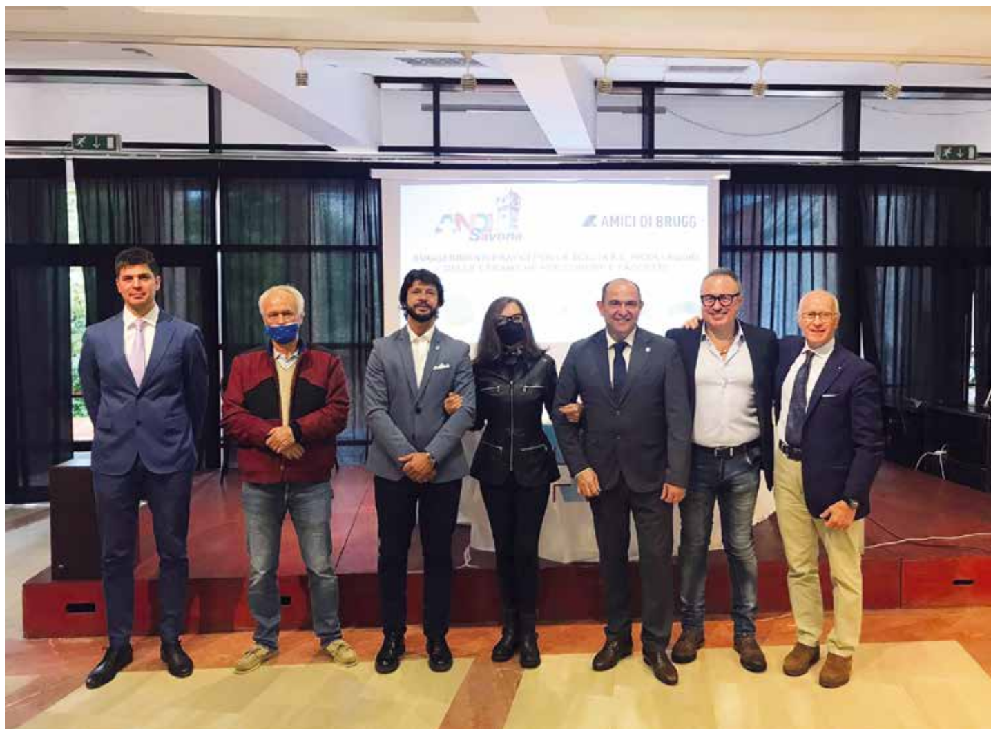
I relatori del Convegno con i Dirigenti ANDI Savona