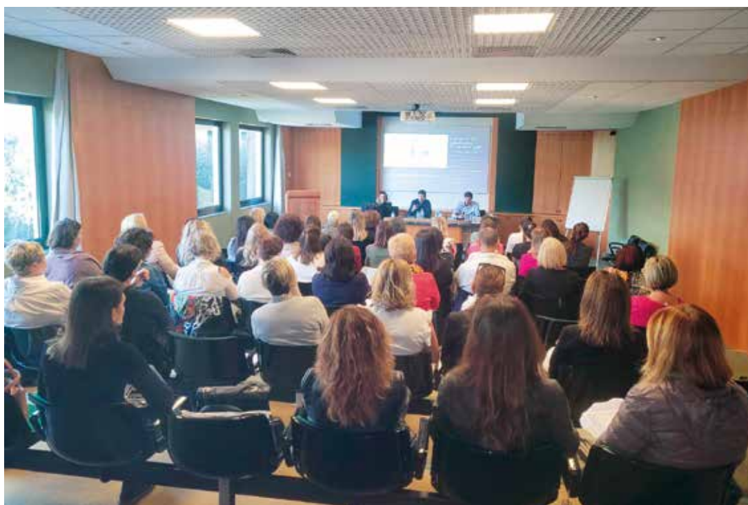
La platea del Corso ANDI Imperia