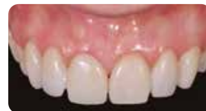
1 settimana dopo: il provvisorio è perfettamente integrato e i tessuti sani