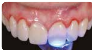
Polimerizzazione 40" a elemento