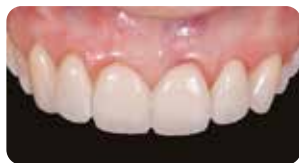
Prova faccette con Try in Gel