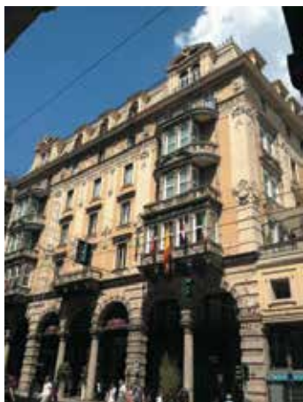
Hotel Bristol di Via XX Settembre