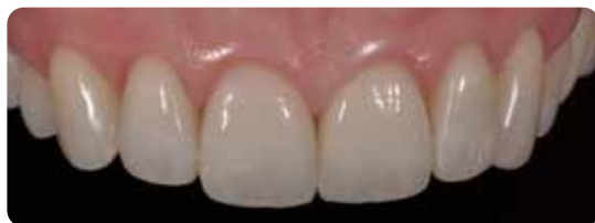
Le faccette in ceramica dopo la cementazione