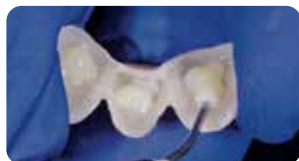
Applicazione Ena Soft Flow per la cementazione dei provvisori