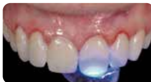
Polimerizzazione per 60 secondi