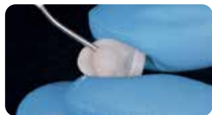
Applicazione Try-in gel nelle faccette in ceramica per prova colore