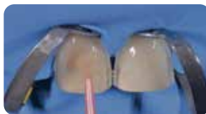
Cementazione faccette: fase adesiva con Ena Bond per 40 secondi