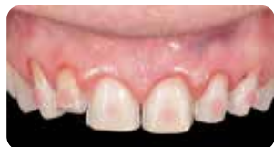
Mordenzatura a spot e applicazione Ena Seal per cementazione provvisorio

Ena Cem HV è un composito flow, fotopolimerizzabile, ad alta viscosità, messo a punto dal Dr. Lorenzo Vanini, che valorizza l'estetica delle faccette sia in ceramica che composito. L'alta viscosità e la alta tissotropia garantiscono una perfetta manipolazione per una facile applicazione e rimozione degli eccessi.