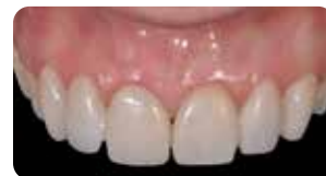
1 settimana dopo: il provvisorio è perfettamente integrato e i tessuti sani