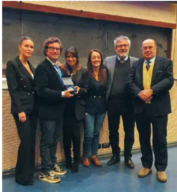
Gli organizzatori e i relatori del Convegno SIOI

La partecipazione è stata numerosa con soddisfazione degli organizzatori e della S.I.O.I. stessa.